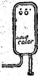
localizator de apă cu curgere constantă

Mașini de cusut electrice Mașini de cusut manuale Mașini de spălat automate Mașini de tricotaș Aparate de produs sifon cu sirop Mașini de întins și tăiat paste făinoase Morți cu site Storcător centrifugal Cutite și tricege de vînatore Arme de vînatore