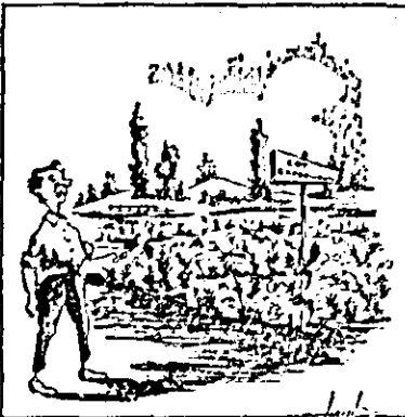
— O fi o experiență pentru... — Buruienii și scamele!

Lotul experimental al Școlii de 8 ani nr. 7 din Sîncolaul Mic este prost îngrijit, buruienile au întrecut plantele.