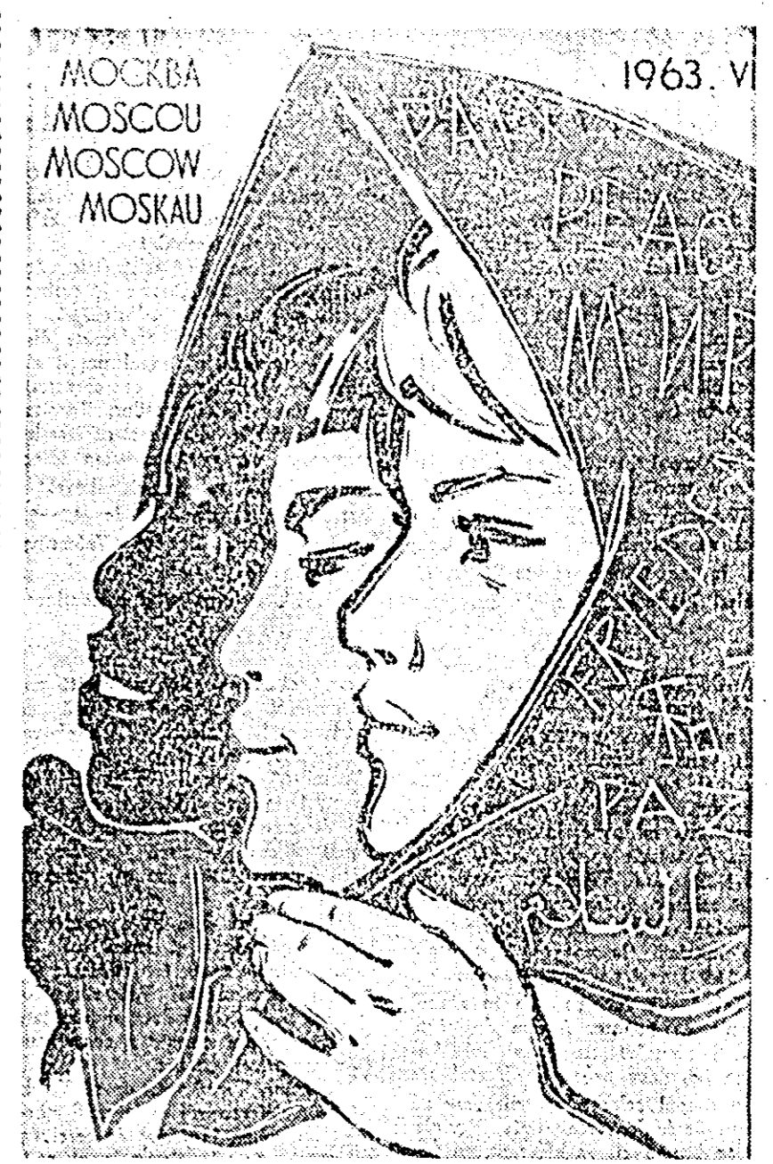
Aflșul celui de-al V-lea Congres Mondial al Femelor...