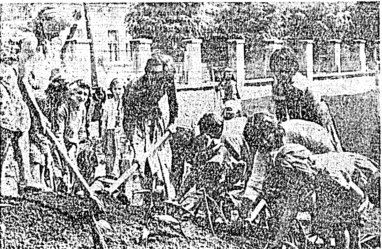
În perioada zilelor de practică, elevii Școlii de 8 ani nr. 10 din Gal, pe lângă lucrările practice executate în ateliere, au efectuat și unele lucrări de amenajare a unui parc în curtea școlii. ÎN CLIȘEU: un grup de elevi plantînd răsadurile de flori în noul parc amenajat.

Dar aceste rezultate nu trebuie să ne facă să uităm de unele deficiențe existente în organizarea și desfășurarea activităților practice continue. Pînă la încheierea perioadei de practică mai sînt doar câteva zile. Totuși, se pot lua unele măsuri operative care să ducă la îmbunătățirea situației, mai ales în ceea ce privește punctualitatea cadrelor didactice care au răspunderea conducerii lucrărilor. Activitatea practică a elevilor are o importanță deosebită, de aceea trebuie să i se acorde toată atenția.