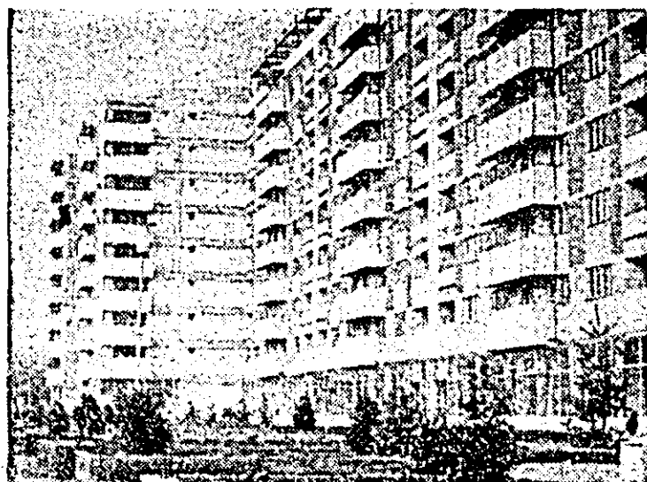
Pe zi ce trece, alte și alte noi blocuri de locuințe, conferă cartierului Aurel Vlaicu din municipiul aspectul unei zone moderne în plină dezvoltare urbanistică.

Prin ampla analiză a activității din industrie și alte sectoare economice, prin complexele sarcini trasate, cît și prin marjonele direcției de acțiune stabilite pentru îndeplinirea în cele mai bune condiții a planului pe acest an, cuvîntarea tovarășului Nicolae Ceaușescu la Consiliul de lucru de la C.C. al P.C.R. se constituie într-un amplu și mobilizator program de acțiune pentru toți oamenii muncii din patria noastră.