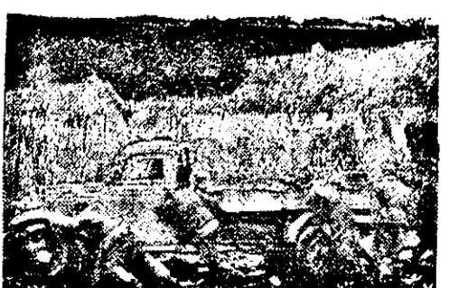
So es an der Ostfront garnicht mehr weitergehen will, muß ein ganzes Kommando von den vielen Kriegsgefangenen helfen.

Istanbul. (EW) Der Schiffraum-mangel hat in Ägypten zu einer völligen Unterbindung der Ausfuhr geführt. Zur Zeit befinden sich in den Lagerhäusern der Häfen mehr als drei Millionen Stück Eier. Man befürchtet, daß diese, falls sie nicht halb abtransportiert werden können, oder die Kommando-Truppen nicht einmarschieren, verderben. Infolge des Ueberangebots haben die Eierpreise in Ägypten einen bisher noch nie erreichten Tiefstand angenommen.