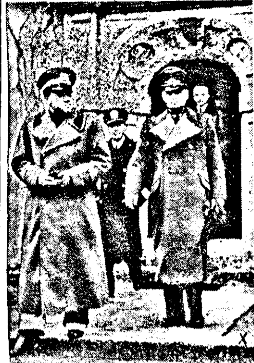
Reichsaußenminister von Ribbentrop und der italienische Außenminister Graf Ciano