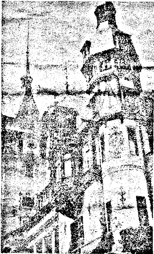
Castelul Peleș din nou în circuitul turistic (detaliu).