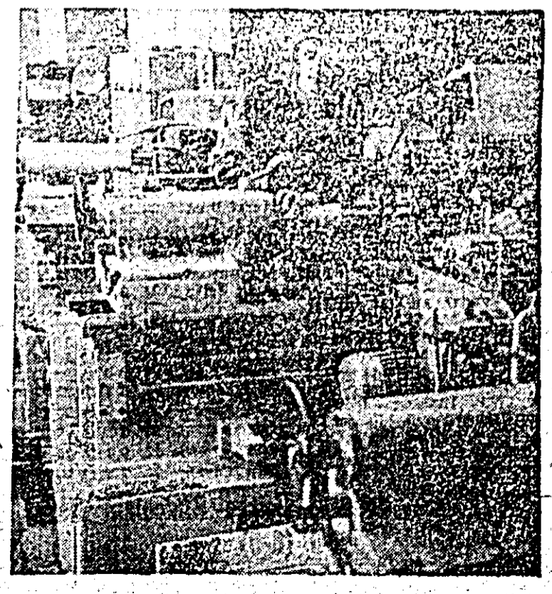
La I.S.A. un nou lot de strunguri este pregătit pentru recepție.