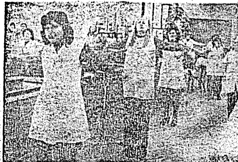
După cîteva ore de muncă, cîteva clipe de destîndere printr-o gimnastică — imagine cotidiană la întreprinderea „Victoria“.

LA TIMIȘOARA: Electromotor — Strungul Arad 2-0. LA TG. MUREȘ, în meci amical: A.S.A. — U.T.A. 2-1.