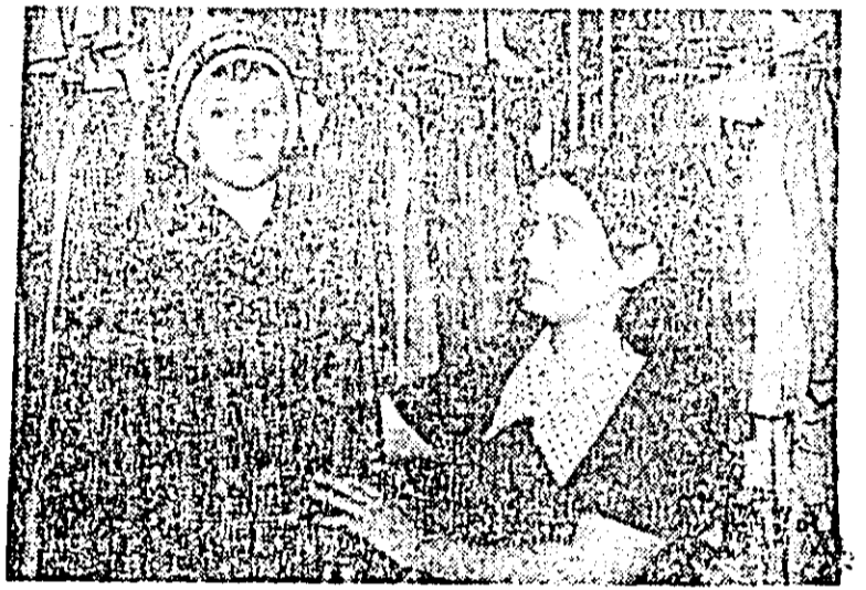
Un magazin bine aprovizionat cu îmbrăcăminte de sezon pentru copii — „Pionierul” din municipiul Arad.