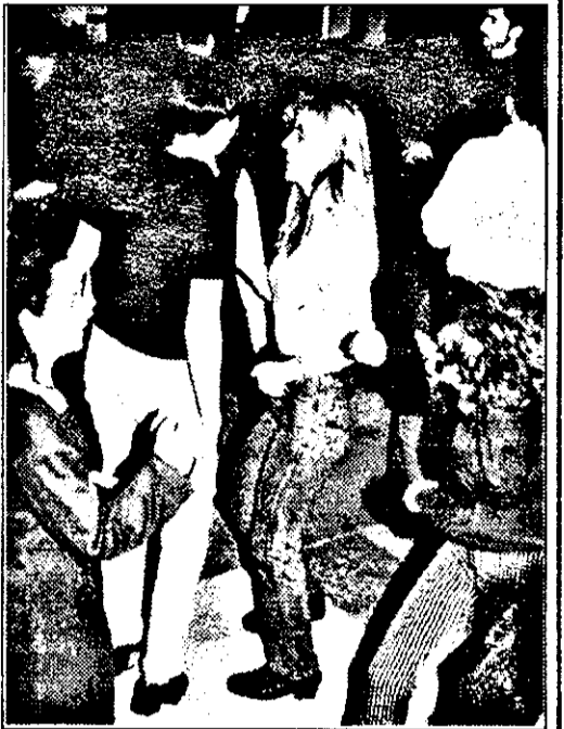
Se dansează în draci la „Joia studentească”.