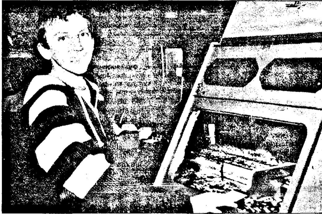
„Hai mam! Aici sunt banii dumneavoastră.”

jocurile de noroc, ieri dimineață s-a organizat un raid prin mai multe baruri al căror profil de activitate, printre altele, sunt și jocurile de noroc. Înainte de toate trebuie să spunem că majoritatea celor legitimați deși unii trecuseră de 14 ani, n-aveau asupra lor buletinul de identitate.