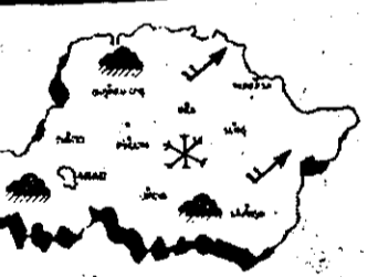
Meteorolog, IULIU VRASGYAV

Vremea va fi închisă și se va răci. Vor cădea precipitații atât sub formă de ploaie, cât și lapoviță și ninsoare. Vânt moderat din NE și E, cu intensificări locale. Temperaturi maxime: 0 la 5°C. Temperaturi minime: -5 la -1°C.