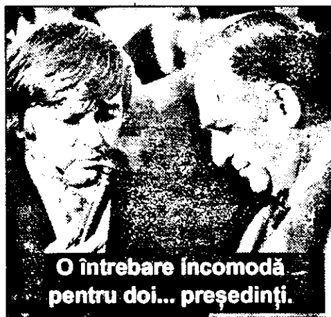
O întrebare incomodă pentru doi... președinți.

DORU SAVA; G. CONSTANTINESCU (Continuare în pagina a 7-a)