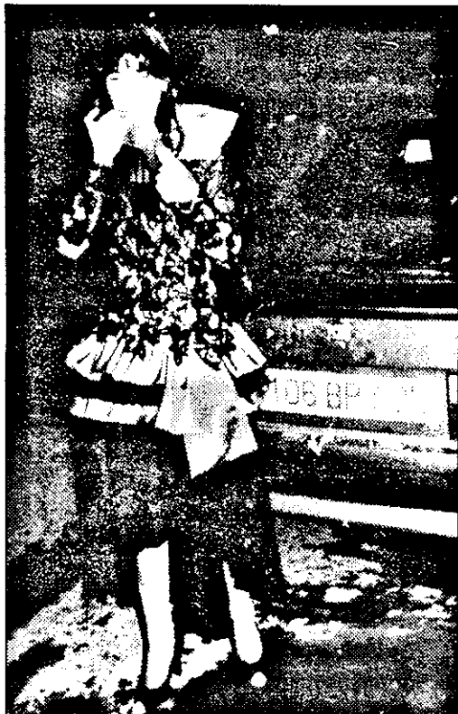
„Am băut ceva lichid roșu. Dracu știe ce era?”

Creдем că faza cea mai tare din raidul nostru a fost momentul cu „nașa”. Pe numele ei adevărat,