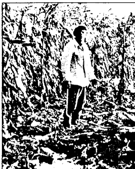
Anul acesta la Peregu - Mic se anunță și la porumb producții mari (peste 9.000 kg/ha). Dacă se va întâmpla însă ca și cu grâul...