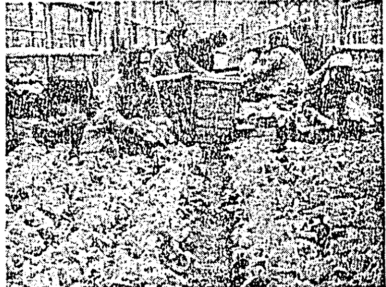
La întreprinderea agricolă de stat „Sere” Arad recoltatul trifundalelor este în toi.

— În ultimul timp, procesul de diversificare a producției în întreprinderea noastră a făcut pași însemnați. Pe fluxul de montaj, tipurile noi de strunguri apar la intervale de timp din ce în ce mai scurte. Seriele de producție sînt tot mai mici. De aici o complexitate de probleme: schimbarea sculelor, reamplasarea unor mașini, repartizarea oamenilor în funcție de noile operații. Aceasta, bineînțeles, necesită timp, muncă în plus, eforturi pentru reorganizare. Mai mult, inerția, obișnuința de a munci într-un anumit fel creează greutate în ce privește operativitatea asimilării noului produs, folosirea spațiilor, utilizarea capacităților de producție. Imperativul