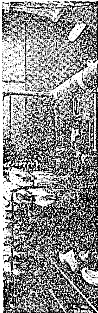
Secția de calapoade a fabricii „Libertatea”.