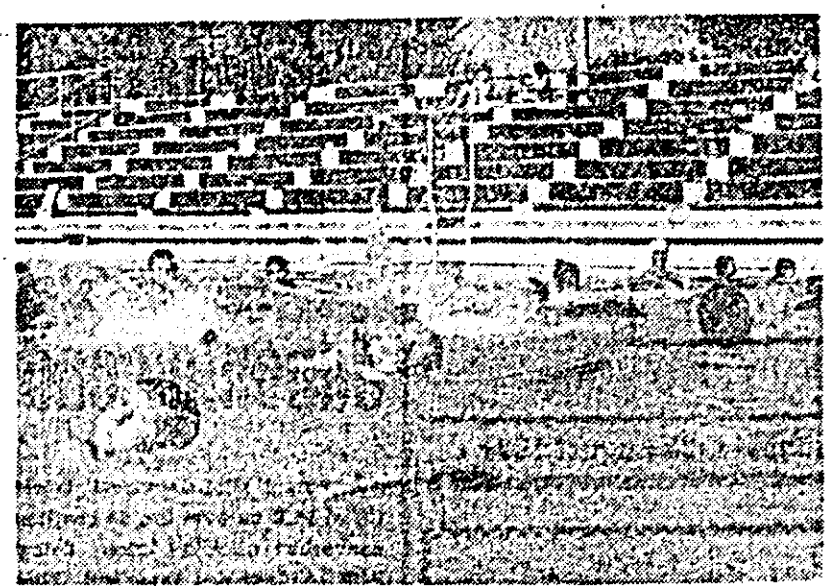
Clupe plăcute de vacanță la bazinul de înot din Pădurice.

contemporan și-un semen de-ai nostru. Lumini și umbre compun — în același consens dialectic, aminat mai sus — imaginea care se încheie cu nota optimistă a înținerii perpetue: „De anotimpuri sulțetești sînt plin, / dar n-au cu celelalte — asemănate: / schimbarea lor, cînd pleacă sau revin, / nu îine pasul după calendar”. Inceput cu în-