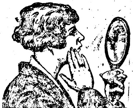
A CADUM-KENŐCS minden bőrdaganatot enyhít és gyógyít