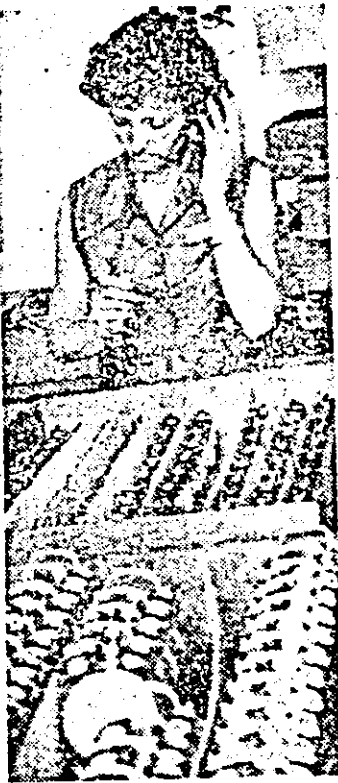
Instantaneu din atelierul de prinderii de ceasuri „Victoria”.

Festivalul național „Cîntarea României e Civica: La cooperativa „Precizia” continuă să persiste multe... imprecizii; Informație pentru toți; Foileton; Controlul oamenilor muncii în acțiune e Telegrama externe.