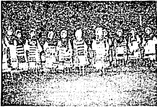
Grupul vocal folcloric al Școlii generale din Sicala.