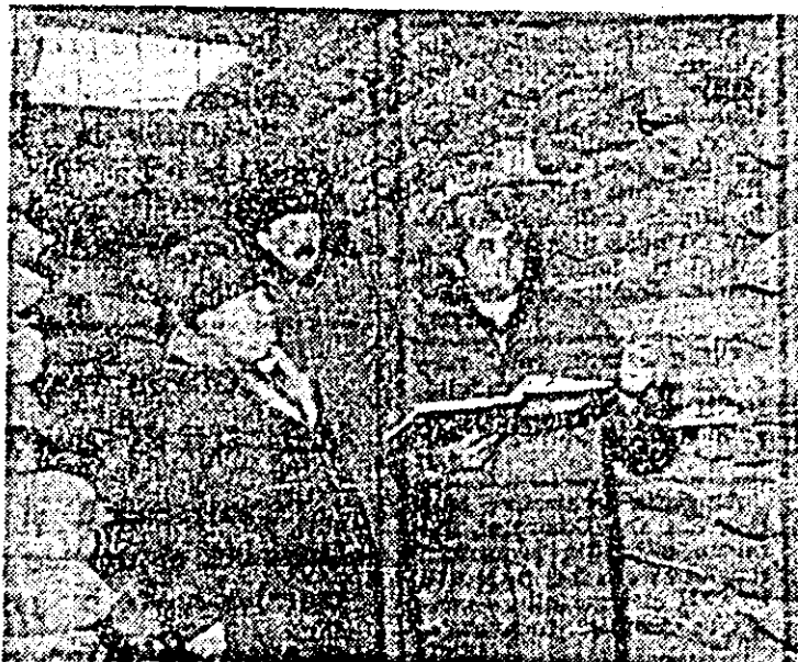
Zilnic se verifică stocul de mărfuri și sînt luate măsuri operative pentru aprovizionarea magazinelor.

În felul acesta s-a renunțat la o serie de spații de depozitare insalubre, aflate în subsoluri, unde se produceau deprecieri de produse, cheltuieli suplimentare în manipulare. În noile condiții, s-au făcut eforturi pentru mecanizarea operațiilor principale. Pentru preluarea uleiului de la vagon s-au dotat cu două cisterne a 50 tone, iar pentru aprovizionarea magazinelor, I.C.R.A. dispune de o autocisternă de opt tone. În noile spații funcționează motostivuitoare și electrostivuitoare, benzile de transport pentru a asigura o preluare și o expediție operativă a mărfurilor. Noile dotări au dus și la stimularea