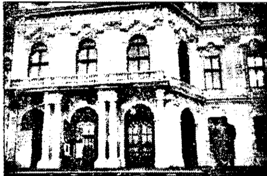
În acest palat, în august 1940, s-a produs un criminal diktat împotriva României. Palatul se numește „Belvedere” și este situat în Viena, culmea, vizavi de Ambasada României.

Se spune despre unii că sunt mai civilizați decât alții, că o țară și un popor este mai civilizat. Exprimarea aparține vorbirii comune și nu are nimic de-a face cu civilizația și cultura, înțelese din punct de vedere filosofico-sociologic. Se vorbește, de obicei, că ungurii sunt mai civilizați decât românii și lor înșile le place să se împăuneze cu acest superlativ. Este, oare, așa? Dacă tratăm problema din punct de vedere filosofic, al bogăției și zestrei spiritual-materiale a unui popor, nu poate exista comparație. Din punct de vedere al gândirii comune, lucrurile stau altfel. Politică este o trăsătură a civilizației, ca și manierele, dar nu trebuie confundate cu civilizația sau cultura. Este același lucru cum ai reduce fructul la măr. De la început trebuie admis că Ungaria face eforturi mari pentru a se occidentaliza, pentru a asimila civilizația occidentală – și acest lucru îl face de mai mulți ani. Noi facem, în special după 1989, același lucru, dar cu o opoziție mult mai pronunțată, determinată de bagajul spiritual moștenit în codul propriei noastre civilizații, acumulate în timp de peste două milenii.