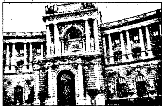
Din palatul Hofburg, împărații habsburgi conduceau această parte a lumii. Și astăzi, deși Austria este o țară mică, aici se fac și se desfășoară tot felul de probleme „europene”.

O țară mică, cu o datorie de vreo 30 de miliarde de dolari, considerată solvabilă oricând, putând să împrumute orice sumă. Dar în spate nu stă, oare, Germania? Nu este mica țară neutră cea care face jocul marilor puteri în acest spațiu central și est-european? Nu are pe conștiință - nu singură, e drept - masacrele din fosta Iugoslavie? Nu se tratează aici problemele OPEC și chiar ale terorismului și spionajului internațional, și nu adăpostește importanțele sedii ale ONU, devenite, din solii ale păcii, solii mascate ale escaladării violenței sub scutul SUA?