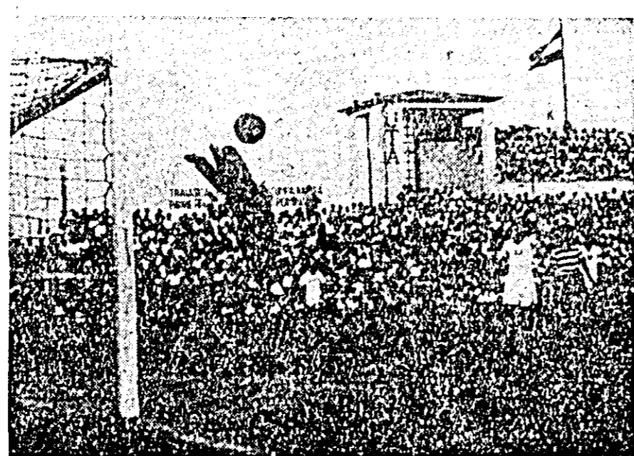
Clișul întâlțșează un aspect al meciului.

poartă, îi pasează lui Jucă, acesta trage puternic dar portarul reține. Acțiunile textiliștorilor sînt foarte rapide. Cu un minut mai târziu, același Jucă trage foarte periculos și puternic, portarul Cosma salvînd în comer. Mulțumii parcă de rezultat, arădenii încep să slăbească alura, cedînd inițialia oaspeților. Privind jocul textiliștorilor, îi făcea impresia că vezi jucînd o echipă care are cel puțin cinci puncte avantaj și nu mai poate fi învinsă de nimeni. Lucrurile n-au stat tocmai așa. Oaspeții joacă hotărît să egaleze, ceea ce au și reușit. În minutul 30, Știrbei reduce scorul