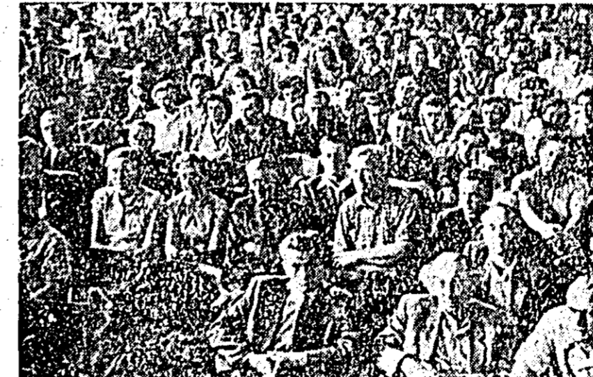
ÎN CLISEU: aspect de la consfăţuirea cadrelor didactice din raionul Arad, care a avut loc în sala şcolii medii nr. 1 din oraşul nostru.