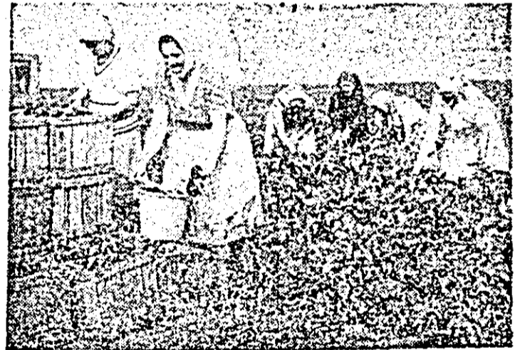
La ferma nr. 11 a Asociației legumicole din Hortia culturul legumelor de sezon se desfășoară din plin.