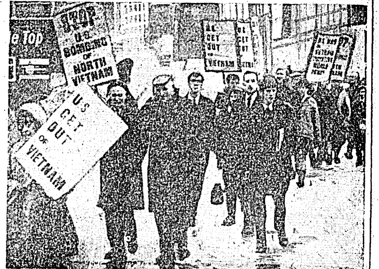
Recent, în orașul englez Liverpool, a avut loc o impunătoare demonstrație de protest împotriva agresiunii SUA în Vietnam.

După cum s-a mai anunțat, la actuala ședință a Consiliului de coroană nu a fost invitat liderul Partidului EDA, J. Passalidis, unul din principalele partide politice din Grecia care deține în parlament 21 de locuri. Referindu-se la această măsură, Andreas Papandreu, care se bucură de încrederea multor deputați ai Partidului Uniunea de Centru, a calificat această acțiune drept anticonstituțională. Partidul EDA a protestat hotărât împotriva lipsirii reprezentanților săi de dreptul de a participa la acest Consiliu.