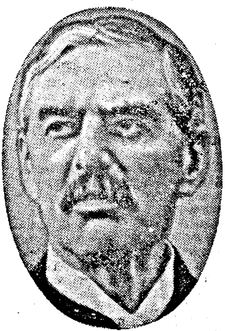
D. Chamberlain, primul ministru Britanic realizatorul acordului dela München.

Mercuri — a doua zi a vizitei Suveranului la Londra — și, mai puțin Joi, Aradul a fost îmbrăcat într'o ceață deasă ce a persistat toată ziua. Asta, pentru a revanșa Londrei simpatia și dragostea cu care a primit pe iubitul nostru Suveran!