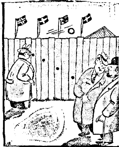
...Creșterea spectatorului clandestin de football...