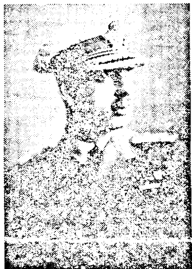
M. S. Regele Carol II.

potrirea celor cari întrebuițează calitatea de student pentru agitații