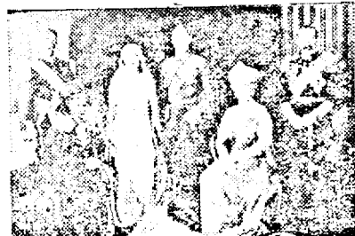
Familia Regală britanică, având în mijloc pe M. S. Regele George al VI-lea și M. S. Regina Elisabetha.

Păzitor al păcii și al celor mai bune relațiuni cu marile țări apusene, Regele României va duce la