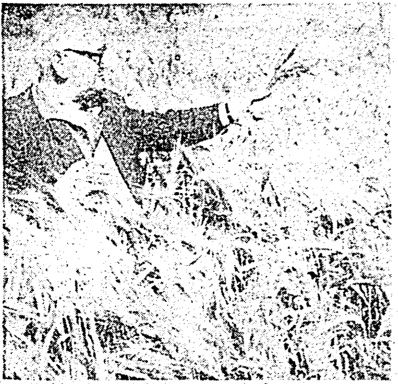
La ferma a V-a vegetală de la I.A.S. Fintinele. Orzul dă spre coacere.