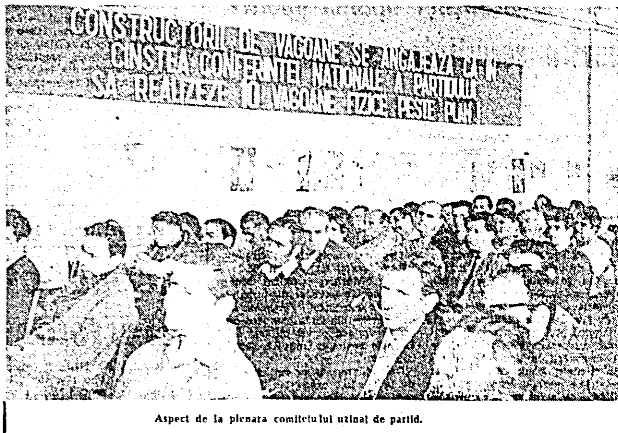
Aspect de la plenara comitetului uzinal de partid.

(NICOLAE CEAUȘESCU, Din cuvîntarea rostită cu prilejul sărbătorii a 80 de ani de existență a Uzinei de vagoane din Arad.)