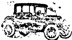
Coupé, 2 ülésel