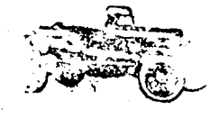
Torpedo, 2 ülésel

Még most is azt hiszi, hogy a Ford magas, ószi, nem a mi izlésünknek megfelelő kocsit?