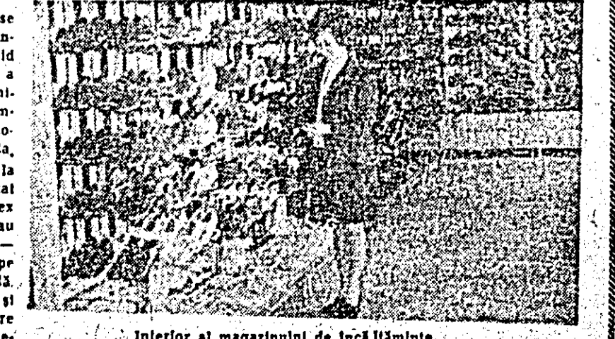
Interior al magazinului de încălziminte.

În prezența a unei numeroase asistente — cetățeni și reprezentanți ai organelor locale de partid și de stat și al Uniunii Județene a cooperativei de consum — duminică s-a dat în folosință noul complex comercial al cooperativei zonale de consum din orașul Pincota.