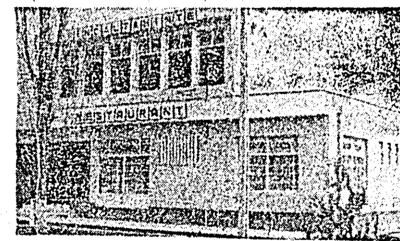
Aspect exterior al noului complex comercial.

În prezența a unei numeroase asistente — cetățeni și reprezentanți ai organelor locale de partid și de stat și al Uniunii Județene a cooperativei de consum — duminică s-a dat în folosință noul complex comercial al cooperativei zonale de consum din orașul Pincota.