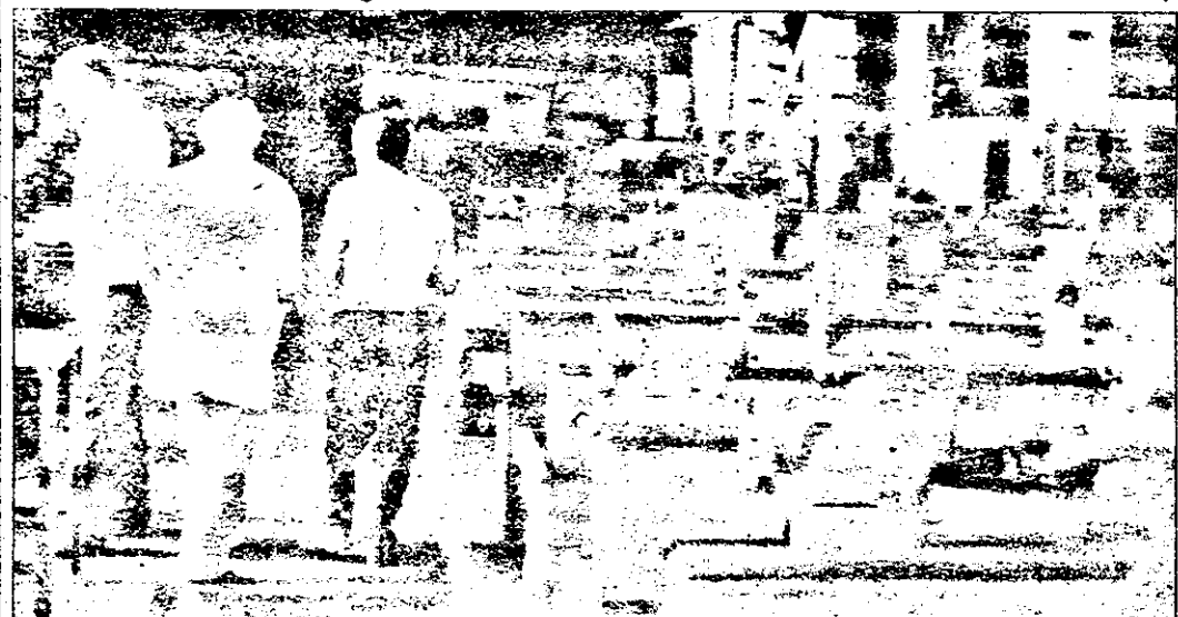
Oare salariile mari din anii '90 și '91 nu au avut nici o contribuție la actuala stare de lucruri de la Aris? Ce părere au sindicatele?