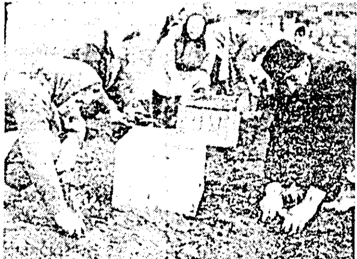
C.A.P. Semlac. Zeci de cooperatori lucrează din plin la plantatul roșiilor în câmp.