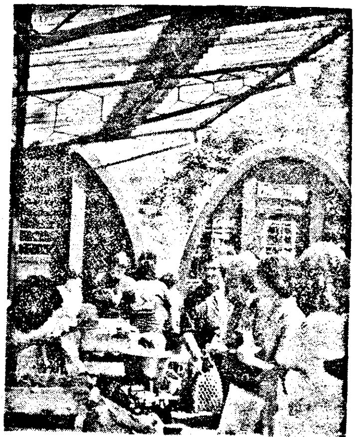
O inițiativă laudabilă a fostei conduceri a Primăriei municipiului Arad, continuată de actuala conducere: reamenajarea și modernizarea Pieței Mihai Viteazul