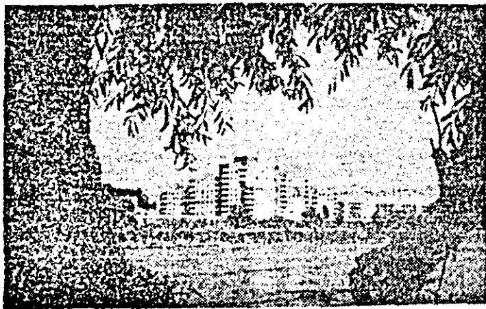
Pe malul Mureșului.

zută toate măsurile anterioare și am adăugat altele noi. De pildă, noi am avut și pînă acum contorizat consumul pe anumiți receptori, dar zilele acestea, pentru a putea urmări și mai amănunțit consumul fiecare dintre ei, am montat încă patru contoare: la birourile administrative, magazie produse finite, magazii materii prime și atelierul mecanic. De asemenea, în secția de calapoade am constatat că puterea de absorbție a ventilatoarelor de rumeșus este supradimensionată. În consecință, prin reorganizarea fluxului de fabricație am elimi-