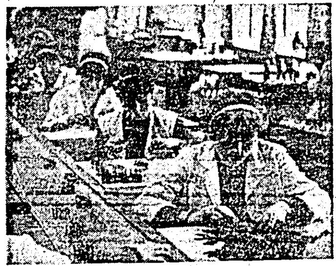
Aspect de muncă în secția de montaj a întreprinderii de ceasornice „Victoria”.