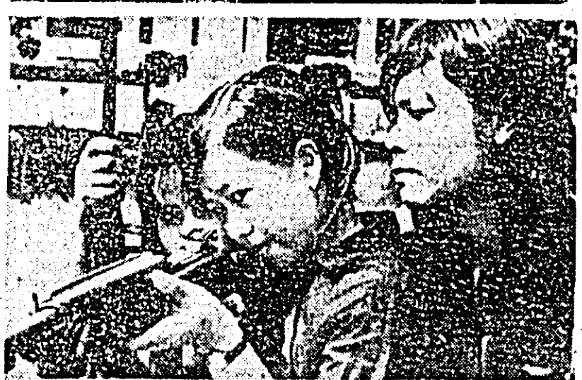
IN FOTOGRAFIE: Exerciții militare de tragere la care iau parte femei încadrate în miliția populară în orașul Stung Treng, partea de nord a Cambodgiei.

BAGDAD 2 (Agerpres). La 1 octombrie, la Bagdad a avut loc solemnitatea deschiderii celui de-al 8-lea Tirg Internațional. După cuvîntul de deschidere rostit de ministrul economiei, Mourlada al-Jadissi, directorul general al tirgului, a urât bun venit delegațiilor prezente la festivități. Re-