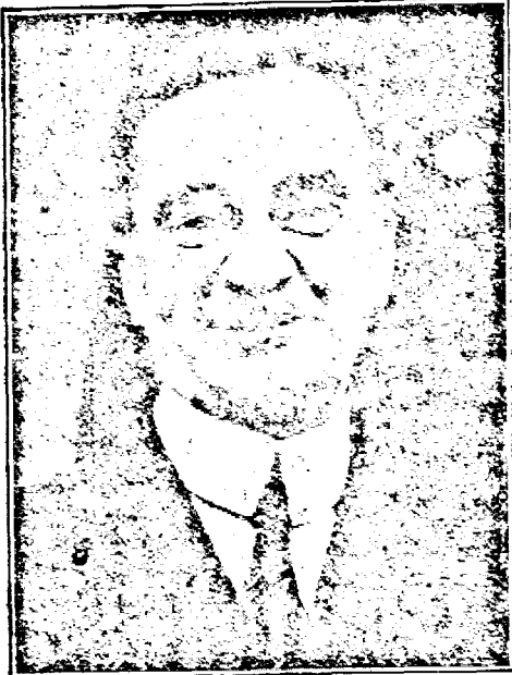
D. Iuliu Maniu, preș. consiliului de miniștri

La parastasul pentru împlinirea a șapte ani dela moartea lui Take Ionescu, dl Iuliu Maniu, președin tele consiliului, a rostit un strălucit discurs. După ce a evocat în chip deosebit de impresionant figura mareului dispărut; după ce l-a încadrat pe Take Ionescu între Ion I. C. Brătianu și Nicolae Filipescu „nemuritorii făpturitori ai desăvârșirii noastre naționale”; după ce a arătat „rolul aproape decisiv în mersul