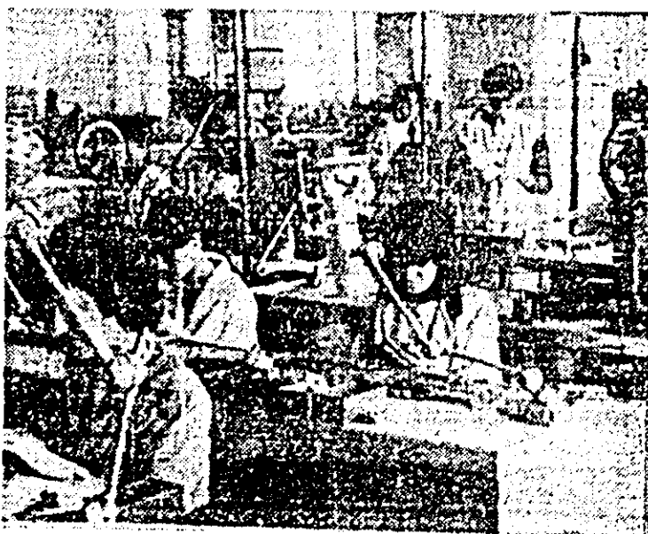
Calitate și precizie, două din atribuțiile muncii desfășurate în cadrul atelierului montaj al I.O.I.

Așa cum sublinia tovarășul Nicolae Ceaușescu, esențial este ca acum, în fiecare întreprindere, în fiecare sector de activitate, să se asigure o amplă și susținută mobilizare a tuturor forțelor, a tuturor oamenilor muncii, în frunte cu comuniștii, astfel încât, prin manifestarea unui spirit de totală dăruire în muncă, fiecare colectiv de oameni ai muncii să-și facă un iluziu de cinste din a întâmpina Conferința Națională a partidului cu rezultate cât mai bune în producție, practic cu planul îndeplinit la toți indicatorii și chiar cu depășirea lui într-o serie de domenii de activitate.