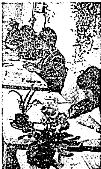
„Arădeanca” — o atenție deosebită se acordă controlului calității produselor.