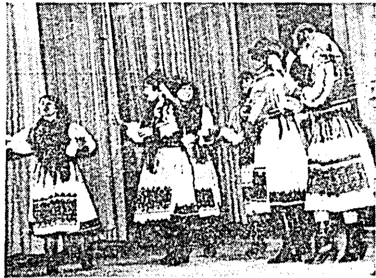
Brigada artistică a căminului cultural din Bocsig într-un instantaneu în fața spectatorilor șirieni.