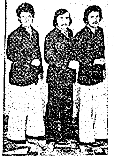
Grupul de satiră și umor al secției prelucrării mecanice de la Întreprinderea de vagoane - pe scena din Curtici.

Spitalul orașenesc Sebiș. Grupuri de satiră și umor: locul I. Căminul cultural Macea și Întreprinderea textilă Arad; II. I.V.A. (Prelucrări mecanice) și Casa de cultură Nădlac; III. Căminul cultural Bocsig și I.S.A. - turnătorie. Formații de estradă: locul I. I.V.A. (Forjă-arcuri) și Casa de cultură „Doina” Lipova; II. I.C.S. Alimentara Arad și Casa de cultură Chișineu Criș.