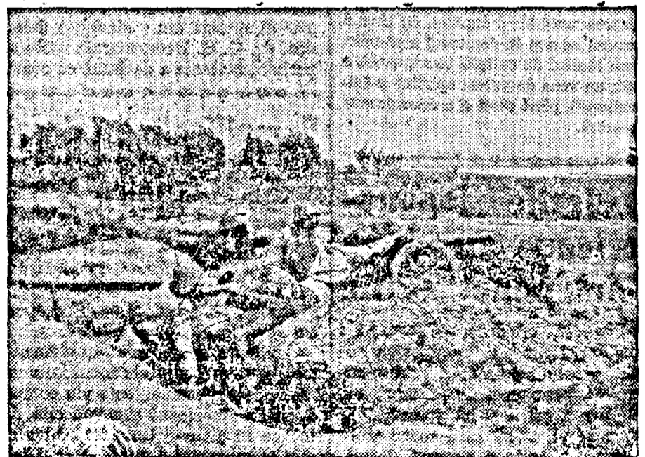
Infanteria română în plină acțiune

Cel brav nu s'abate când cel rău îl frânge, Că cu arma 'n mână se'mbată în sânge.