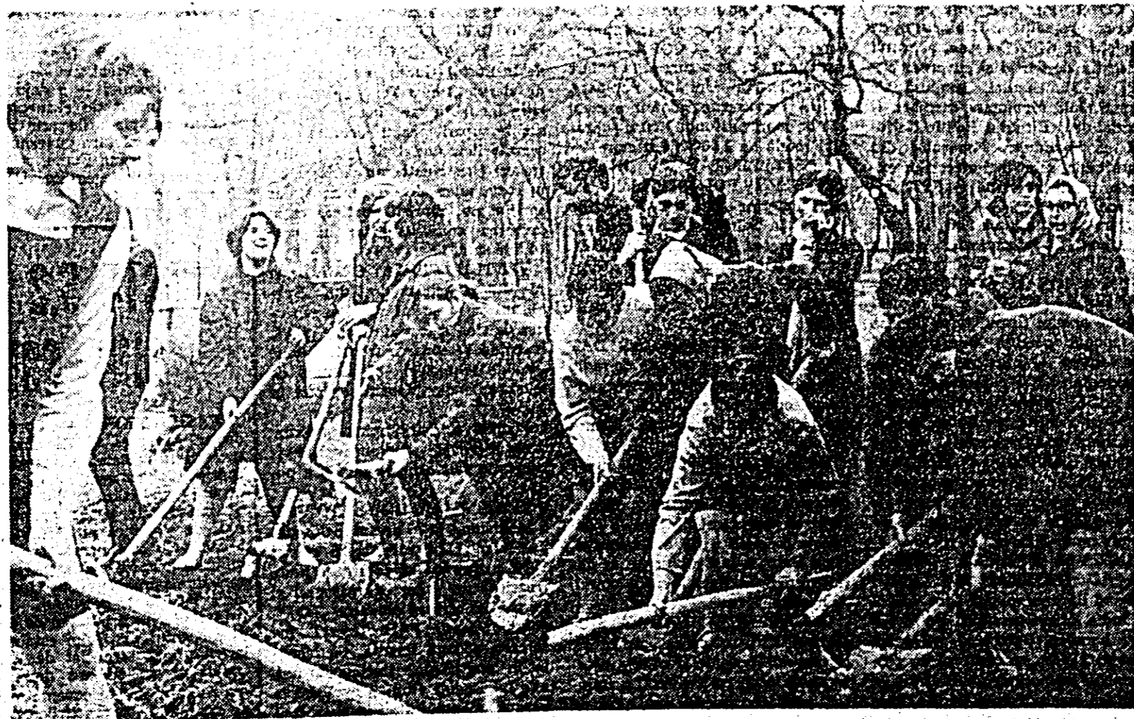
După orele de curs elevii liceelor și al școlilor profesionale din municipiu își dau întîlnire la muncă voluntar-patriotică.