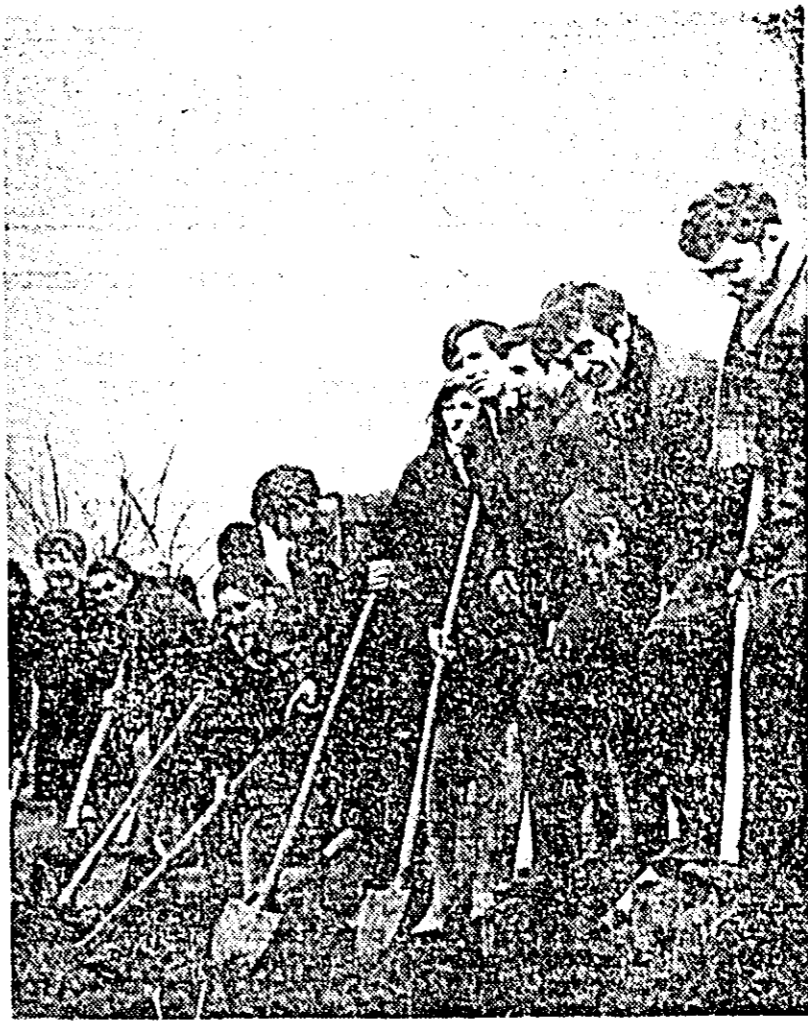
Instantaneu pe șantierea muncii voluntar-patriotice pe malul Mureșului.

Acțiunea de înfrumusețare a întreprinderii prin muncă voluntar-patriotică desfășurată de întreg tineretul de la Uzina de fabricații, reparații și montaj în agricultură din Arad se leagă în mod intrinsec de conștiința acestuia. Iar locul dragostea fierbinte față de locul de muncă.