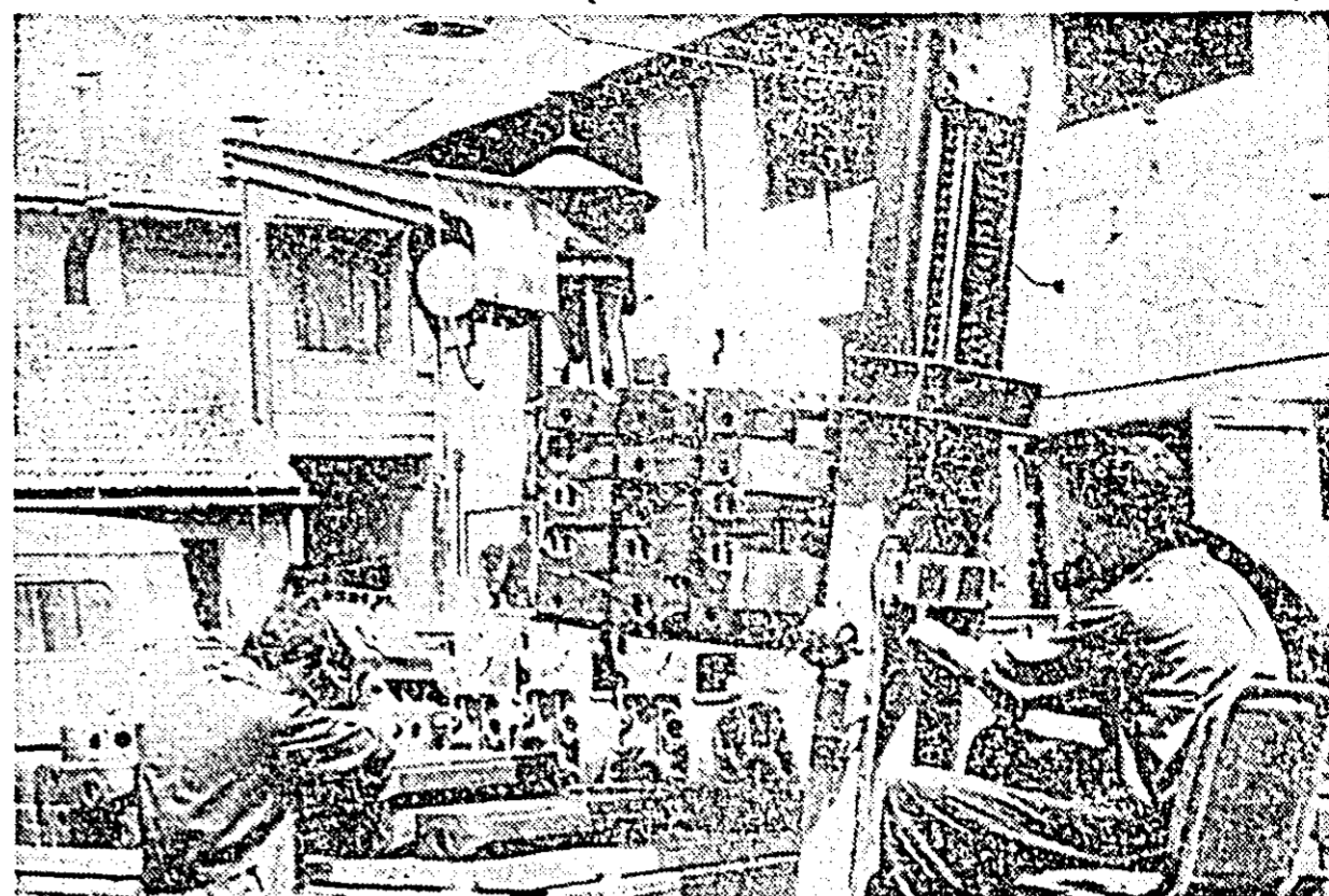
Mecanizarea diferitelor operații de lucru își face tot mai mult loc în atelierele sectorului I al Uzinei de reparații. În clișeu: descărcarea mecanizată a unui lot de chiulase de motor.