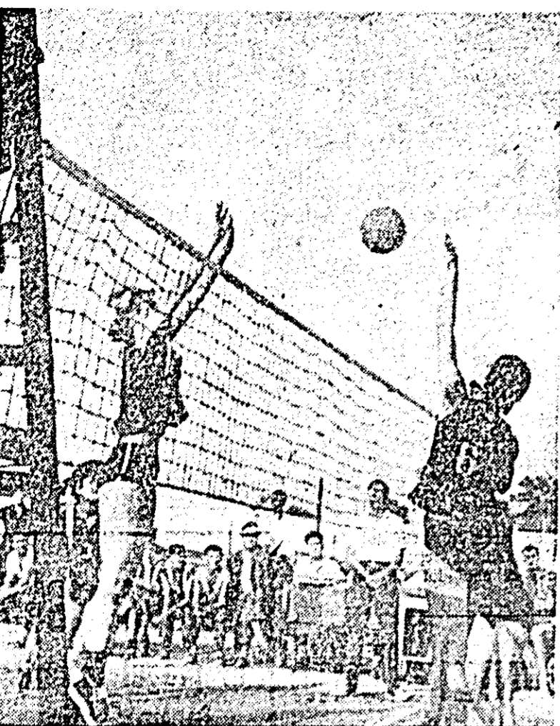
In clișeu: Fază din meciul Sănătatea Arad—Țesătura Plăta Neamț.