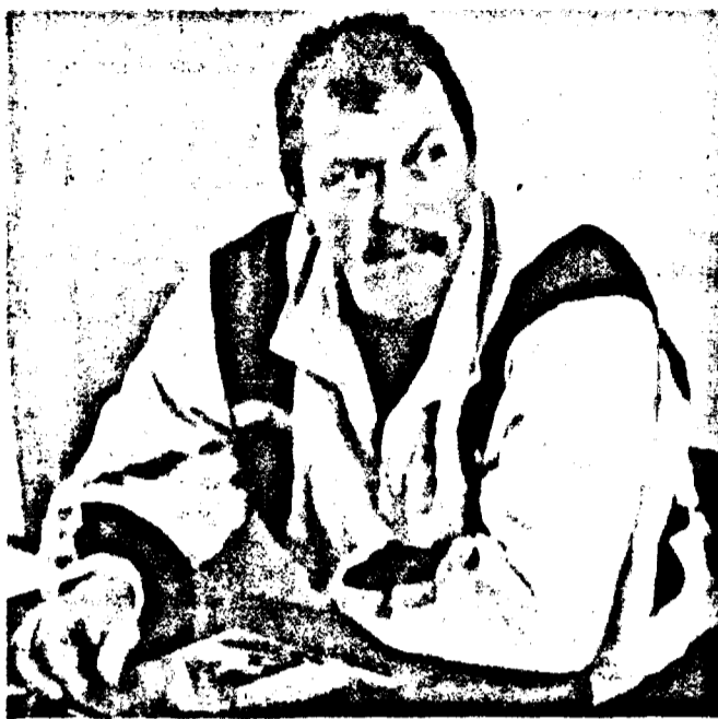
Helmut Duckadam s-a scos în privința transferurilor, anunțând că nu se bagă și nici nu-i treaba lui.