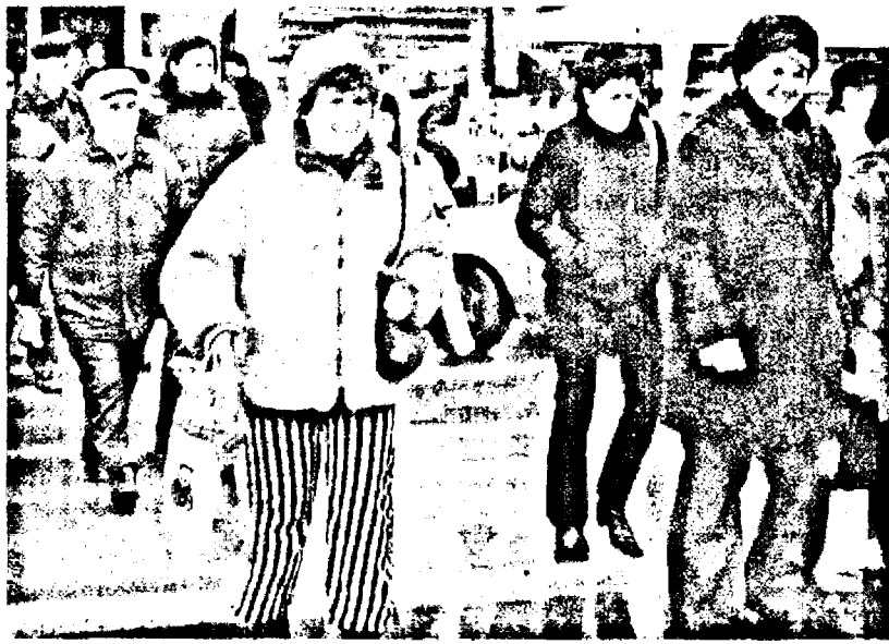
Arădenii se grăbesc să-și plătească dările față de stat!

Municipiul nostru se situează printre primele orașe din țară în ceea ce privește gradul de colectare a veniturilor locale, la aproape toate categoriile depășindu-se deja procentul de sută la sută. Astfel, la impozitul pe clădiri, la persoane fizice, au fost colectate deja peste 86 de miliarde de lei, ceea ce înseamnă un grad de ocupare de 105,5 la sută. La impozitul pe teren, la persoane juridice, unde s-au adunat peste 24 de miliarde de lei, de exemplu, gradul de colectare este de 105,26 la sută. Până în prezent, cei mai muți bani, 128 de miliarde de lei, au fost colectați la impozitul pe clădiri, secțiunea persoane juridice.