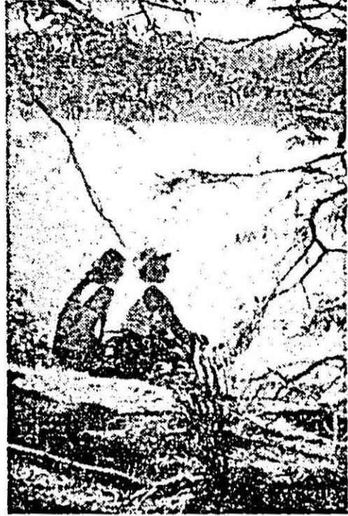
Se duc zilele verii.

cepînd cu cel înlocuit la Șimnartin: „Primarul înstituiează consiliul comunal că dl. Nicolae Titulescu, Ministrul Afacerilor Străine, a luptat și luptă continuu pentru apărarea integrității hotarelor noastre etnice, punînd în serviciul patriei toată știința și puterea sa, sacrificîndu-și chiar și sănătatea în serviciul patriei și națiunii, devenind prin aceasta ca exemplu cetățeanului român...". La data de 5 decembrie 1934, „Consiliul comunal cu unanimitate de voturi își dă dovada de dragoste, stîmă și recunoștință față de acest mare pa-