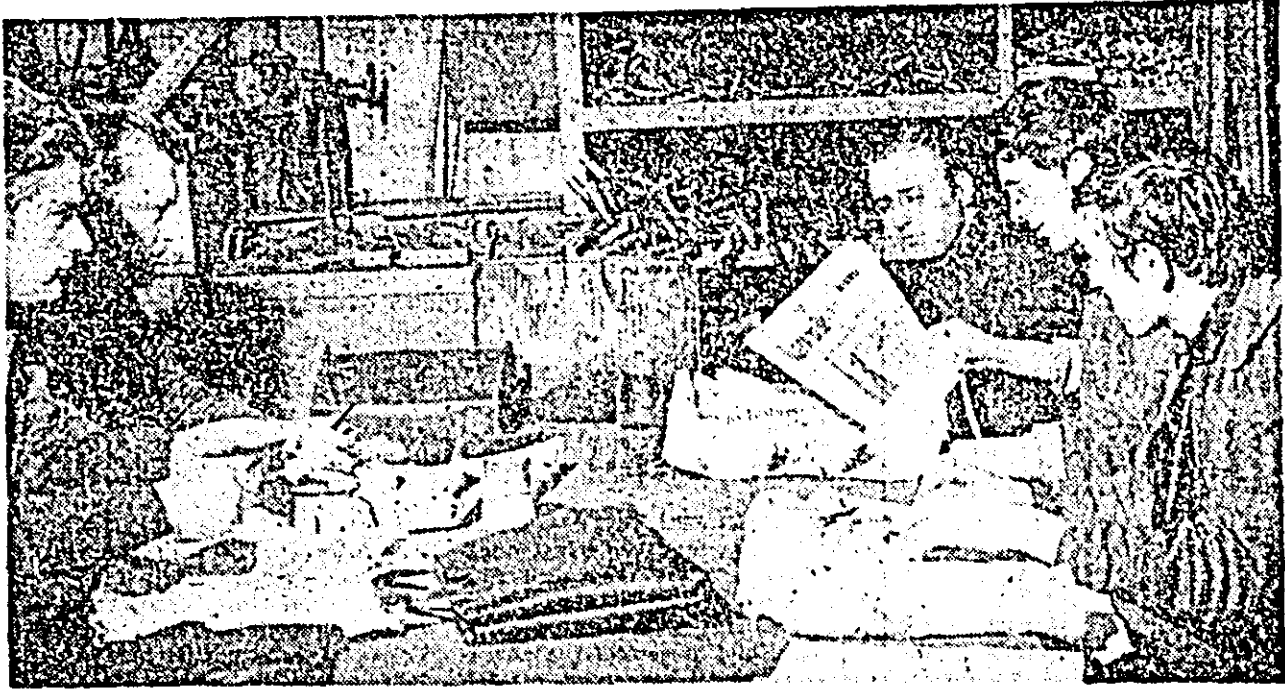
Sectorul II al Uzinelor de vagoane, secția pregătire. În pauza de masă se citește ultimele știri din ziar.

nuind obișnuțelor adunări de producție. Să vedem ce o bună parte din neajunsurile semnalate se datorează și stilului de muncă al comitetului comunal de partid, controlului sporadic executat și mai ales neurmărirea până la capăt a propunerilor adoptate. Pe de altă parte, tot aici am întâlnit o situație care trebuie să stea mai mult în atenția comitetului comunal de partid. Este vorba de folosirea, poate prea mult, a informărilor verbale în ședințele de analiză. Trebuie avută multă grijă atunci când se procedează în acest fel, utilizarea informărilor verbale să se facă în funcție de tematica, de importanța problemelor puse în discuție. În ședințele de birou ale comitetului comunal de partid din luna octombrie și noiembrie 1972, s-au analizat două probleme de mare