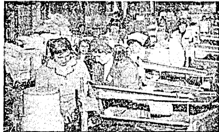
Colectivul atelierului croi de la întreprinderea „Libertatea”, s-a evidențiat prin importante economii de materii prime.