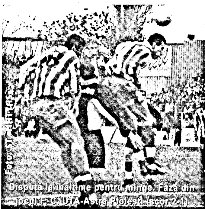
Disputa la înălțime pentru mingea. Faza din jocul F.C. UTA-Astra Ploiești (scor: 2-1)