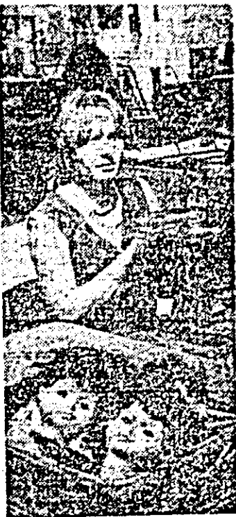
Confectionera Dolna Bacoș este una dintre frunțașele întrecerii socialiste de la întreprinderea „Arădeanca”.