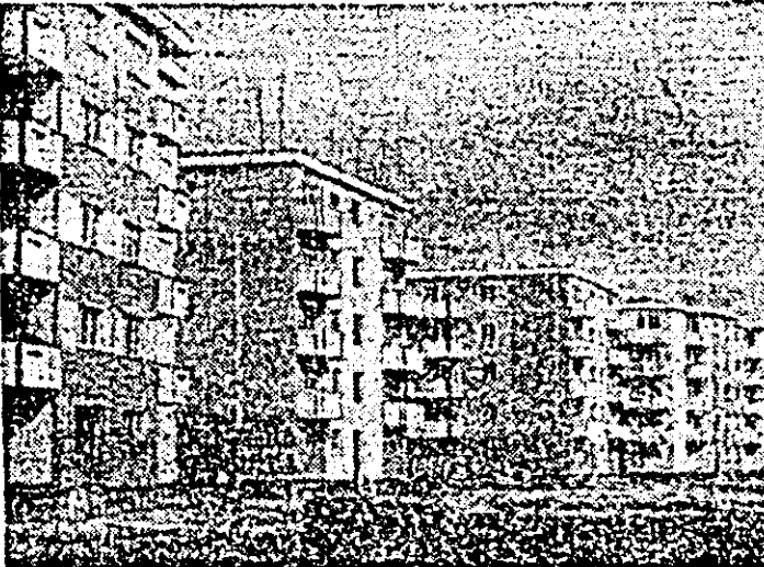
Noi blocuri de locuințe în zona „Alta”.