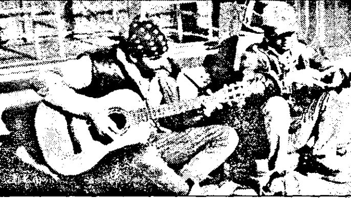
Ieri, o apăsătoare meditație în fața magazinului Central din Arad: doi tineri cântau din chitară, tamburină și block flöte, vrând parca să ne aducă aminte că e primăvară. Erau doi studenți la Psihologie în București care în acest mod „faceau bani de o bere”. Cam scumpă berea, dacă ne luăm după câți bani adunaseră deja! P.S.