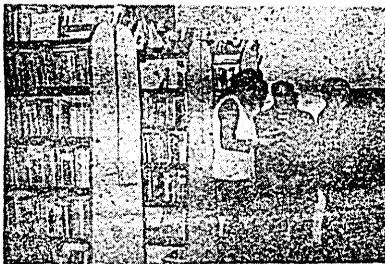
Numerosi sînt locuitorii din Buteni care vizitează biblioteca comunală. ÎN IMAGINE: biblioteca orașului este mai nou aparținînd editoriale cîntitorilor.