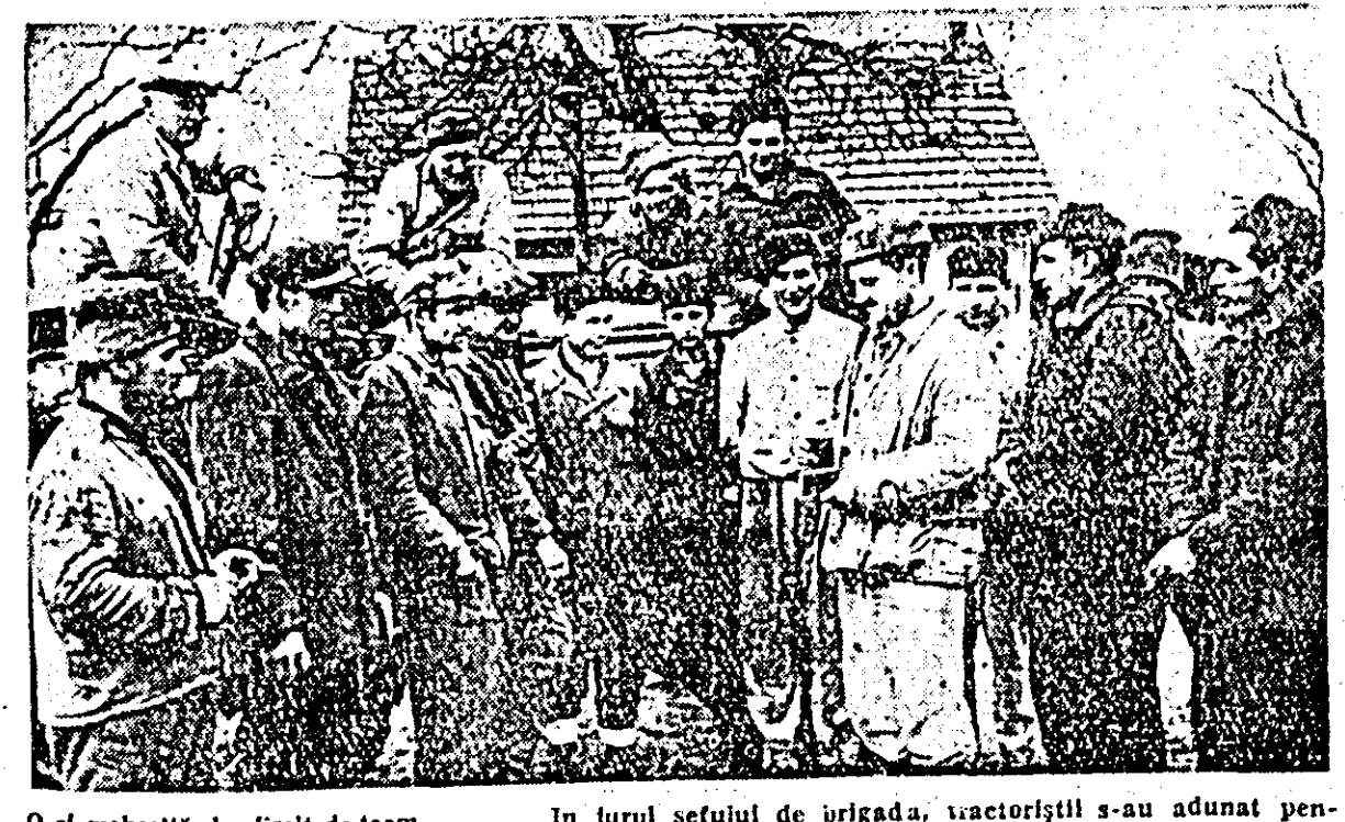
În jurul șefului de brigadă, tractoriștii s-au adunat pentru a se sfătui asupra muncii din ziua următoare.

O zi mohorâtă de slăbit de toamnă. Umezeala plutește peste câmpuri, învăluindu-l într-o pălămie subțire, flecare colțșor. Pământul limbat și el de apă, moale și clesc, primește acum oamenilor o cîmp de răgaz. În drumul nostru, ne oprim pentru un moment la o brigadă de mecanizatori. O brigadă de tractoriști ai SMT ca multe altele ce împlinesc gospodăriile colective din raionul nostru. Pe fruntea pămîntului clădirii, oamenii au scris cu litere mari: „Brigada nr. VI permanentă din SMT Felnaic de servete GAC „Veac nou” din Sînpetru German”, iar dedesubt au desenat un tablou în culori. E lucrat cu măștrul chiar pe pereți, și înălțează un cîmp luminos pe care lucrează tractoarele. Se vede de la bun început, că am poposit într-o brigadă de gospodări. Nu ne înșală nici interiorul curții, care e curată și netedă ca o masă. Dincolo de gardulețul împrejurător zărim „ograda”. Bineînțeles, că nu una înșesată cu pomi, ci cu