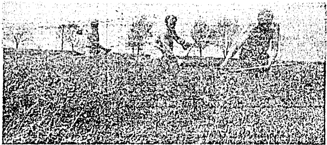
Anul acesta lucerna a rodit bine. Cooperatorii s-au străduit să o strîngă repede și fără pierderi.