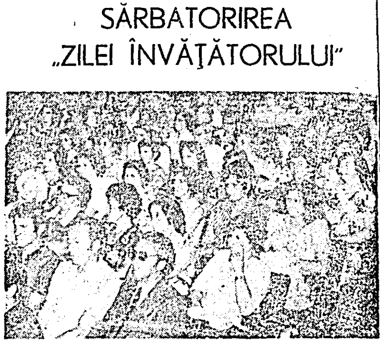
Aspect de la adunarea festivă care a avut loc ieri la Teatrul de stat.

Jeri, dimineață a avut loc în Arad, în sala Teatrului de stat și la Palatul cultural, sărbătorirea, într-un cadru festiv, a „Zilei Învățătorului”.