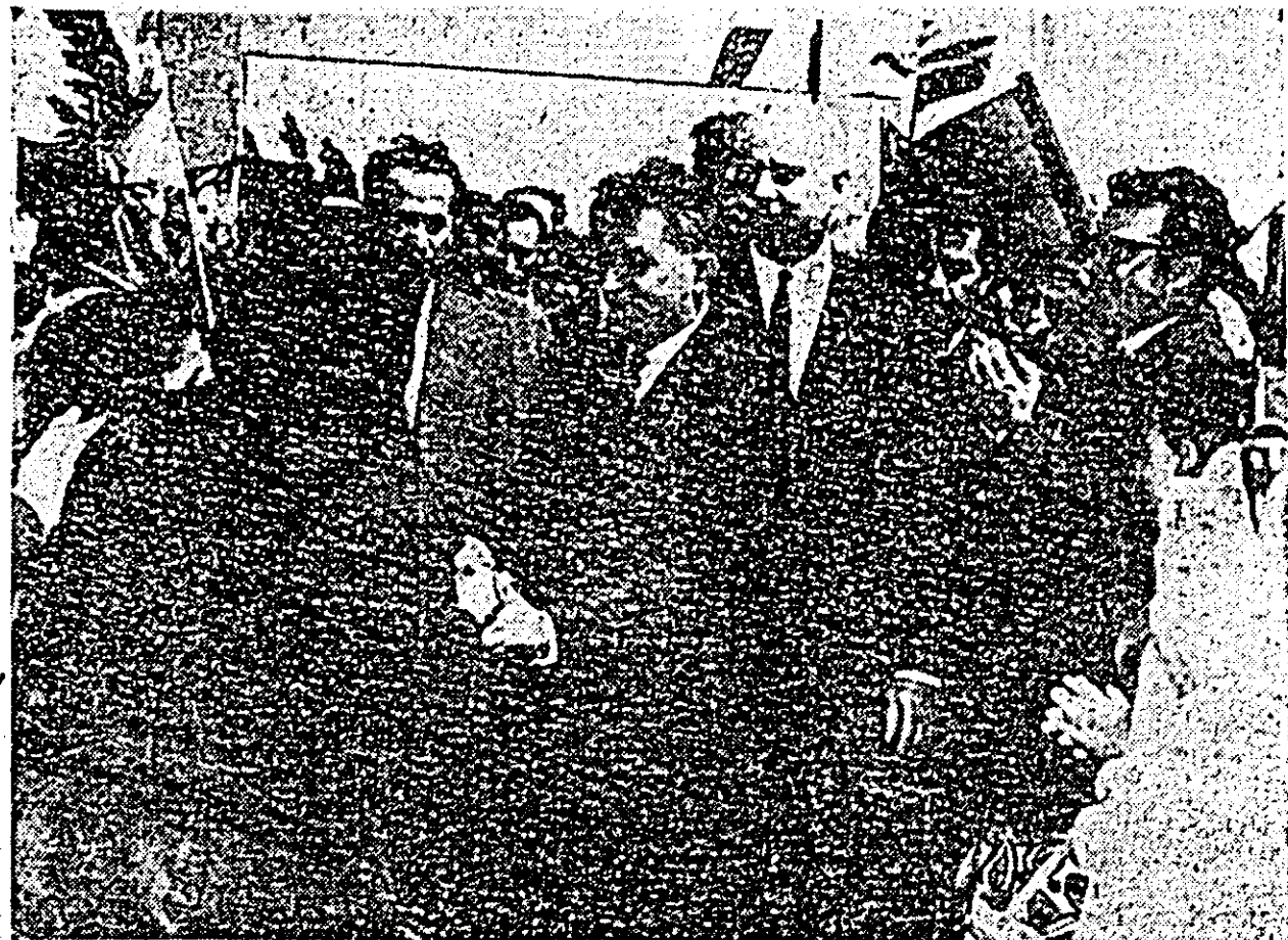
Țărani cooperatori din Zerind au făcut o caldă primire tovarășului Nicolae Ceaușescu la sosirea pe meleagurile județului Arad.