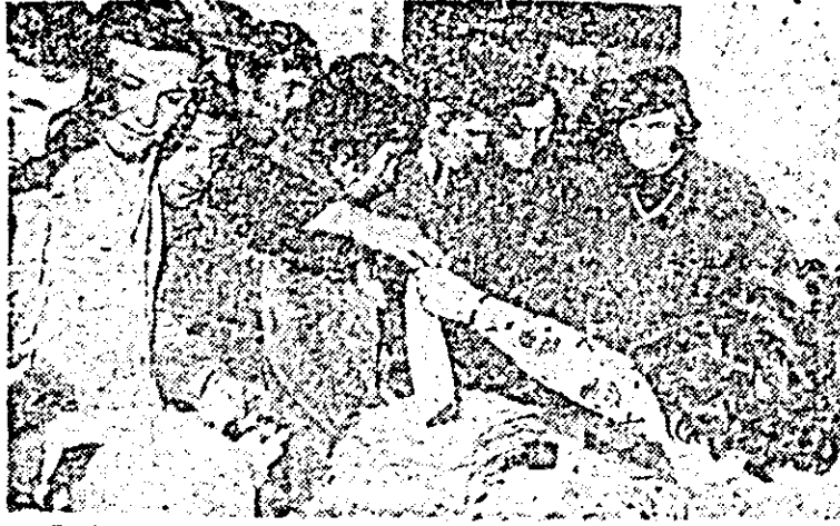
Zeci de angajați de la I.V.A. la rînd pentru a dona sînge.