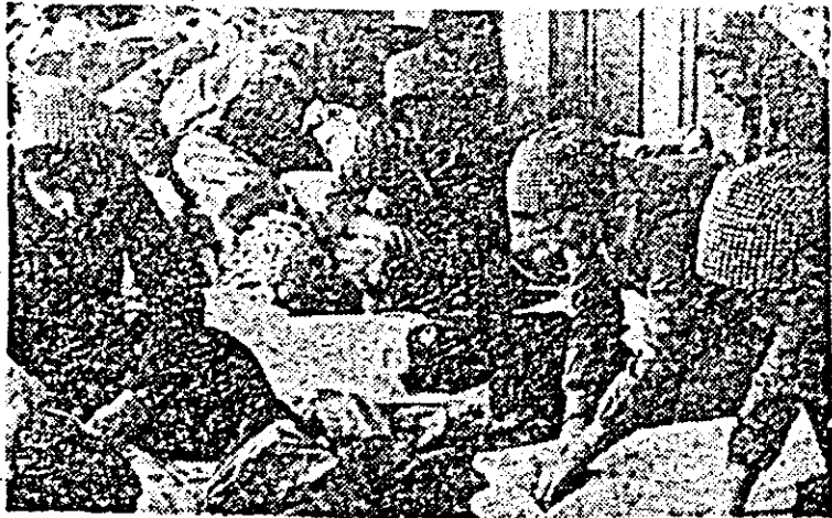
La centrul de colectare a îmbrăcămîntii de la „Teba”.