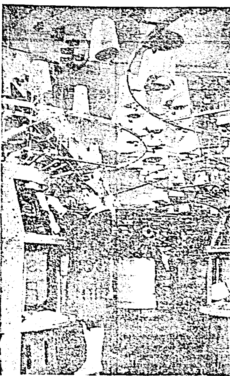
Aspect dintr-una din secțiile de bază a fabricii „Tricoul roșu”: secția de tricouri circulare.

Alt simpozion cultural-artistic literar-muzical a fost urmărit cu mult interes, elevii școlii fiind dornici de a cunoaște cât mai bine istoria de luptă a partidului nostru, felul în care ea este oglinzită în literatura contemporană.