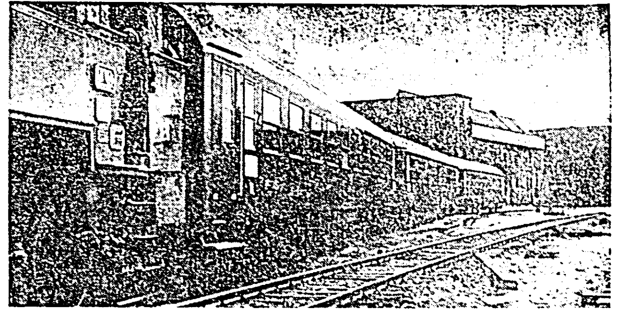
Uzinele de vagoane. Un nou lot de vagoane călători pleacă în probe.

Cei prezenți au păstrat un moment de reculegere în memoria ostașilor sovietici care au căzut în luptele purtate pentru eliberarea patriei noastre. Apoi, din partea uzinelor textile „30 Decembrie”, întreprinderilor „Teba”, Fabrica de zahăr, „Refacerea”, „Libertatea”, SMT Aradul Nou și a altor instituții au fost depuse coroane de flori.