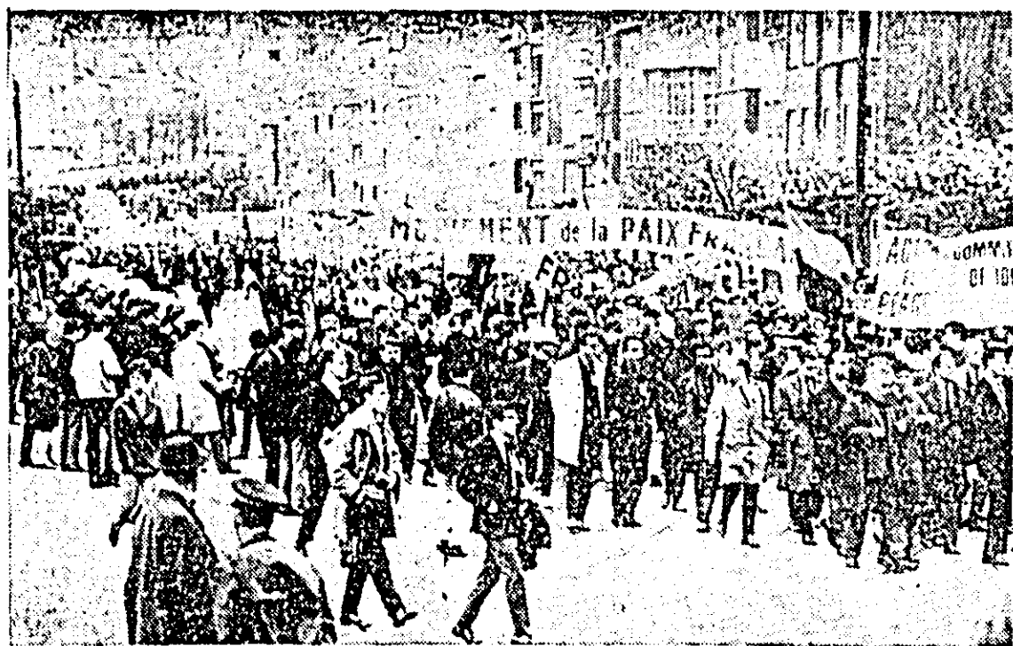
BELGIA: Aspect de la marșul antiatomic care a avut loc recent la Bruxelles.

În ciuda cererilor populației din Okinawa și ale întregului popor japonez privind retrocedarea insulelor Japoniei, de mai bine de 20 de ani SUA continuă să-și mențină dominația asupra Okinawei, transformînd acest teritoriu în cea mai mare bază militară americană din Orientul Îndepărtat.