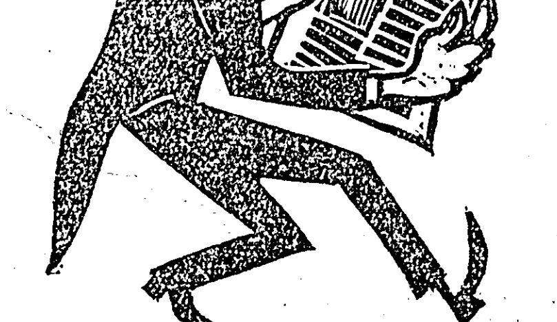
O PALMĂ USTURĂTOARE! Desen de Godel

NEW YORK 19 (Agerpres). TASS anunță: După cum anunță agențiile americane de presă, forțele aeriene militare ale SUA au lansat la 18 august de la baza militară Vandenberg (California), un satelit artificial al Pământului „Discoverer 14” plasându-l pe o orbită polară. Scopul