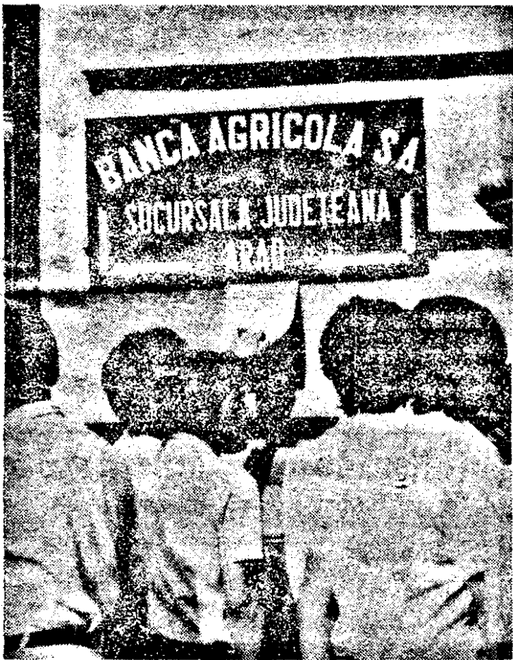
S-a asflat cursul zilei la schimbul valutar. Văi, sîrac, leni...

● După consultări cu Mihail Gorbaciov și Boris Elțin, ministrul apărării al URSS, Evgheni Șapoșnikov a adoptat hotărîrea de a nu se organiza, la 7 Noiembrie, parada militară de la Moscova. După cum transmite agenția TASS, la Ministerul Apărării al Uniunii Sovietice se apreciază că, în actuala situație politică și economică, nu este oportună marcarea aniversării Revoluției din Octombrie, cu participarea de amploare a tehnicii de luptă.