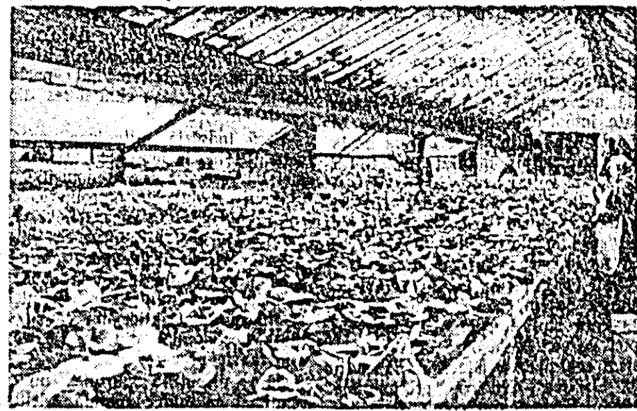
Pentru înfrumusețarea orașului nostru, în seara florărilor statului popular orășenesc se lucrează intens și în timpul iernii. ÎN CLIȘEU: Răsaduri cultivate pentru a fi transplantate în primăvară în parcurile orașului.