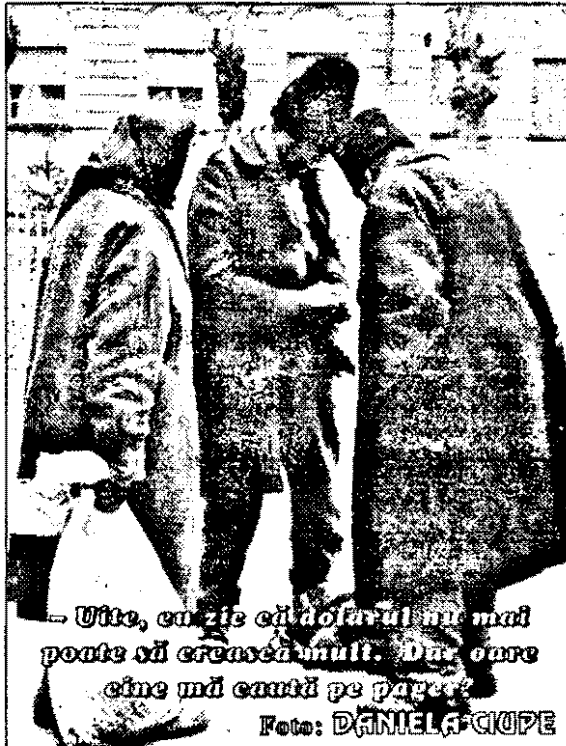
Uite, ce zice că doborâșul nu mai poate să crească mult. Dar, omre cine mă caută pe păpăie!